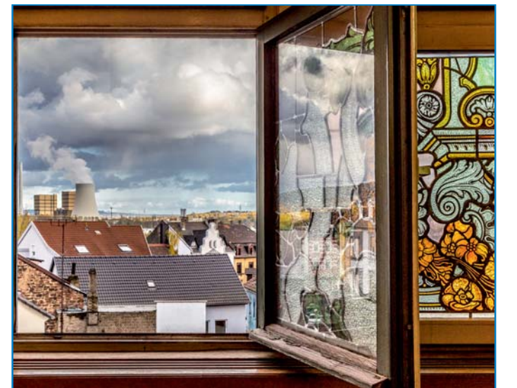
Blick aus dem Alten Rathaus über die Stadt